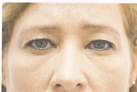
vor der INCO-Zytoenergese®-Behandlung